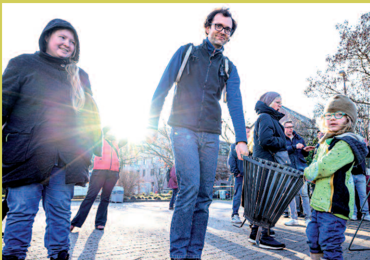
Eine Familie freut sich über ihren neuen Feuerkorb.