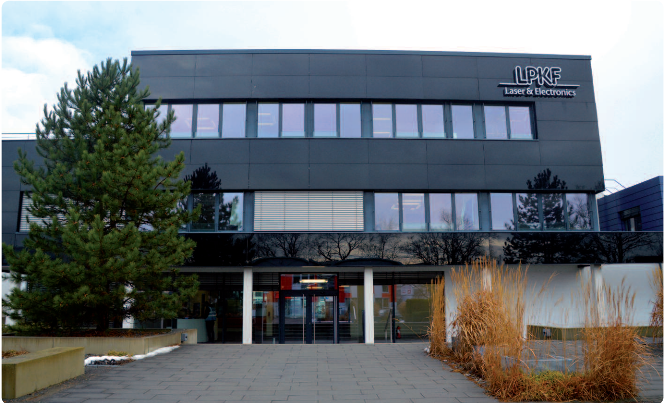
Die Firmenzentrale von LPKF Laser & Electronics in Garbsen