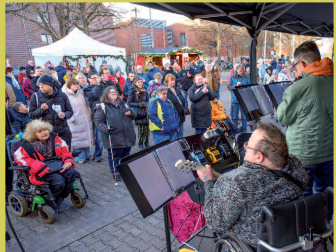
Schon eine Institution: Unser HW-Band "Die Eisbrecher" rocken die Vorweihnachtszeit.