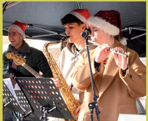
Die "Funky Lemons" sorgen für gute Stimmung und musikalische Untermalung.