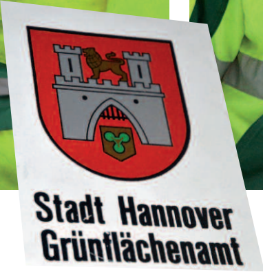
Björn Kaminski: zuverlässig, freundlich, immer gern gesehen

Dieser Außenarbeitsplatz wird begleitet durch das FbI (Fachdienst betriebliche Inklusion)