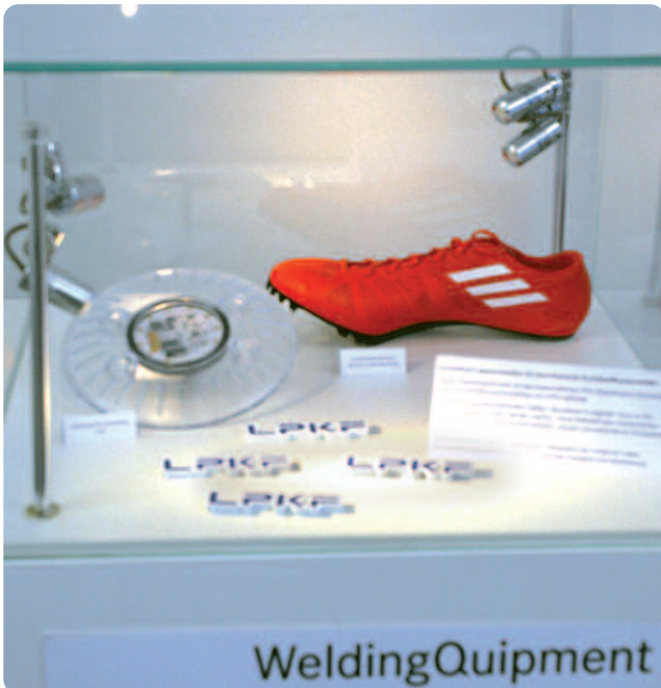
Die Ausstellung im Eingangsbereich der Firmenzentrale zeigt gelaserte Produkte wie diesen Turnschuh, dessen Sohle ohne Klebstoff befestigt wurde.