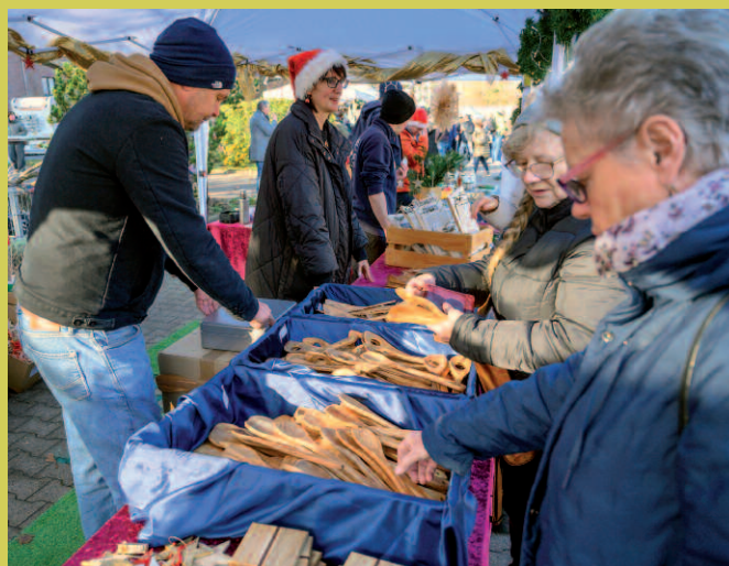
Großer Andrang bei den Bürsten & Besen und am Stand des Holzbereichs: handgemachte Helferlein aus hochwertigen Materialien, Futterstationen und vieles mehr erfreuten sich großer Beliebtheit.