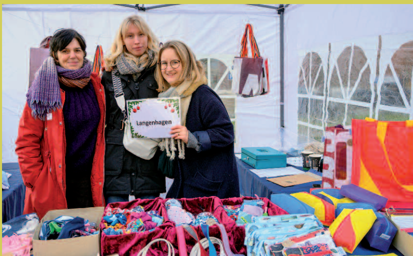
Unser Standort Langenhagen präsentierte tolle Produkte aus der Näherei: Von Lavendelsäckchen bis Mesh-Tasche - alles Handarbeit!