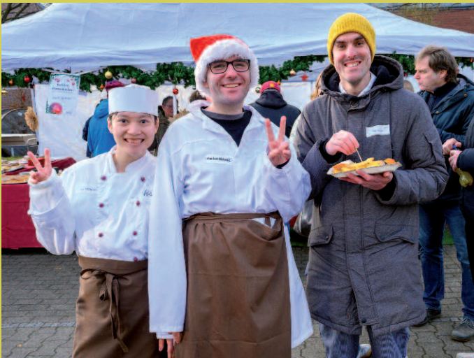
Das Gastro-Team verwöhnte alle mit den beliebten HW-Bratwürsten, Pommes frites und Gulaschsuppe.