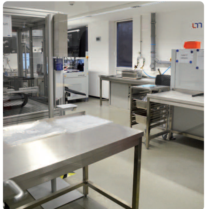
Der sogenannten Sauberraum ist staubfrei und unterliegt entsprechenden Hygienevorschriften.