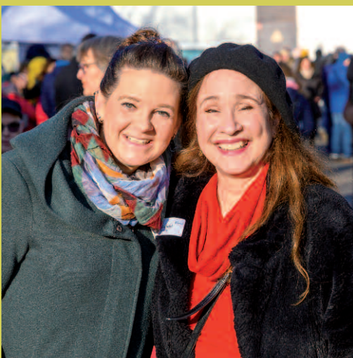
HW-Mitarbeiterinnen freuen sich, dass alles so gut läuft.