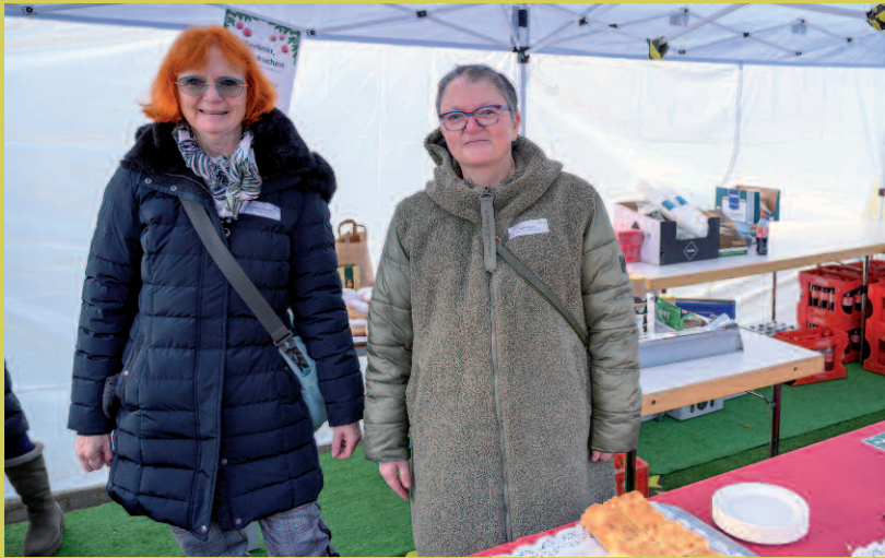
Wir danken unserem Elternbeirat für ihre unermüdliche Unterstützung: auf dem Adventsbasar und über das ganze Jahr hinweg.