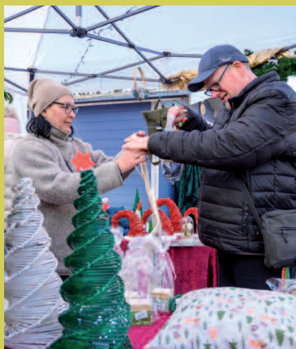
Kunsthandwerk und Schönes aus dem Berufsbildungsbereich

Am dritten Advent lockte der inklusive Adventsbasar der Hannoverschen Werkstätten viele Besucherinnen und Besucher nach Kleefeld – aus dem Stadtteil und aus ganz Hannover. Bei schönem Winterwetter zeigten Menschen aus den Werkstätten, was in den vergangenen Monaten entstanden ist. Die Arbeiten aus Holz und Metall sowie das Kunsthandwerk waren sehr beliebt und Leckeres aus der HW-Gastronomie und vom Eltern- und Betreuerrat schmeckte den Besucherinnen und Besuchern sichtlich.