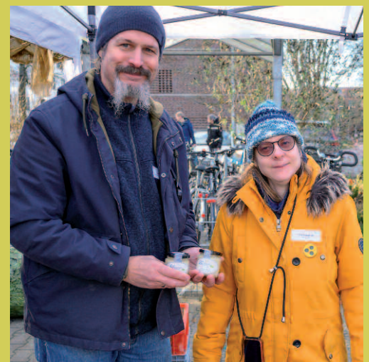
Die fleißigen HW-Bienen sorgten für volle Honigtöpfchen.