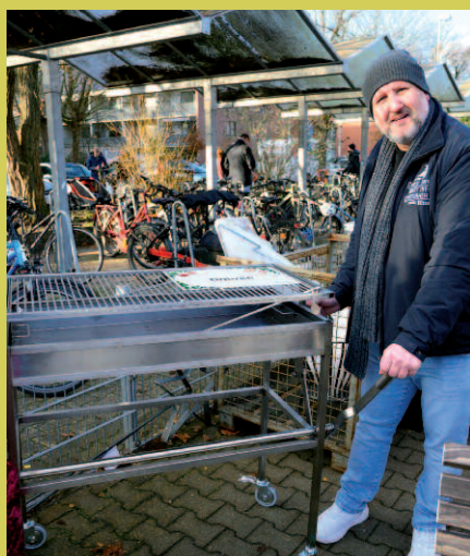
Der Metall-Bereich präsentiert seine Highlights: vom individuell gestalteten Grill bis zum Weihnachtsstern für den Garten.