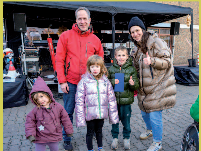
Gewonnen! Bei unserer Verlosung gab es tolle Preise zu gewinnen.