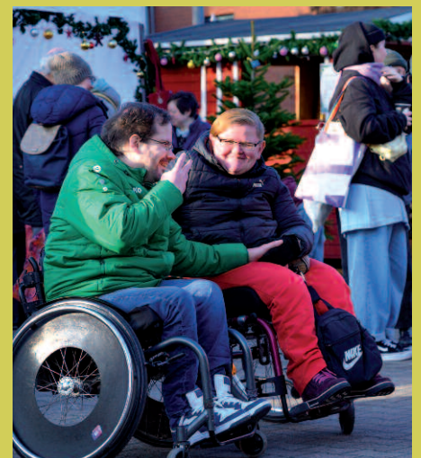
Gute Gespräche inklusive