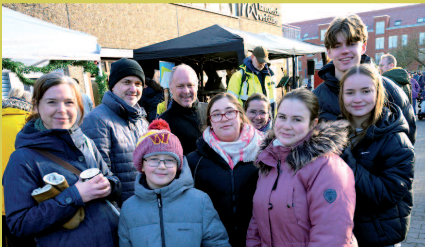
Die Sonne und fröhliche Gesichter brachten alles zum Strahlen.