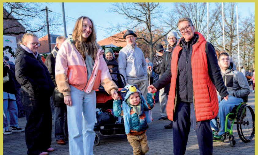
Unser Adventsbasar: Ein Erlebnis für alle Generationen.